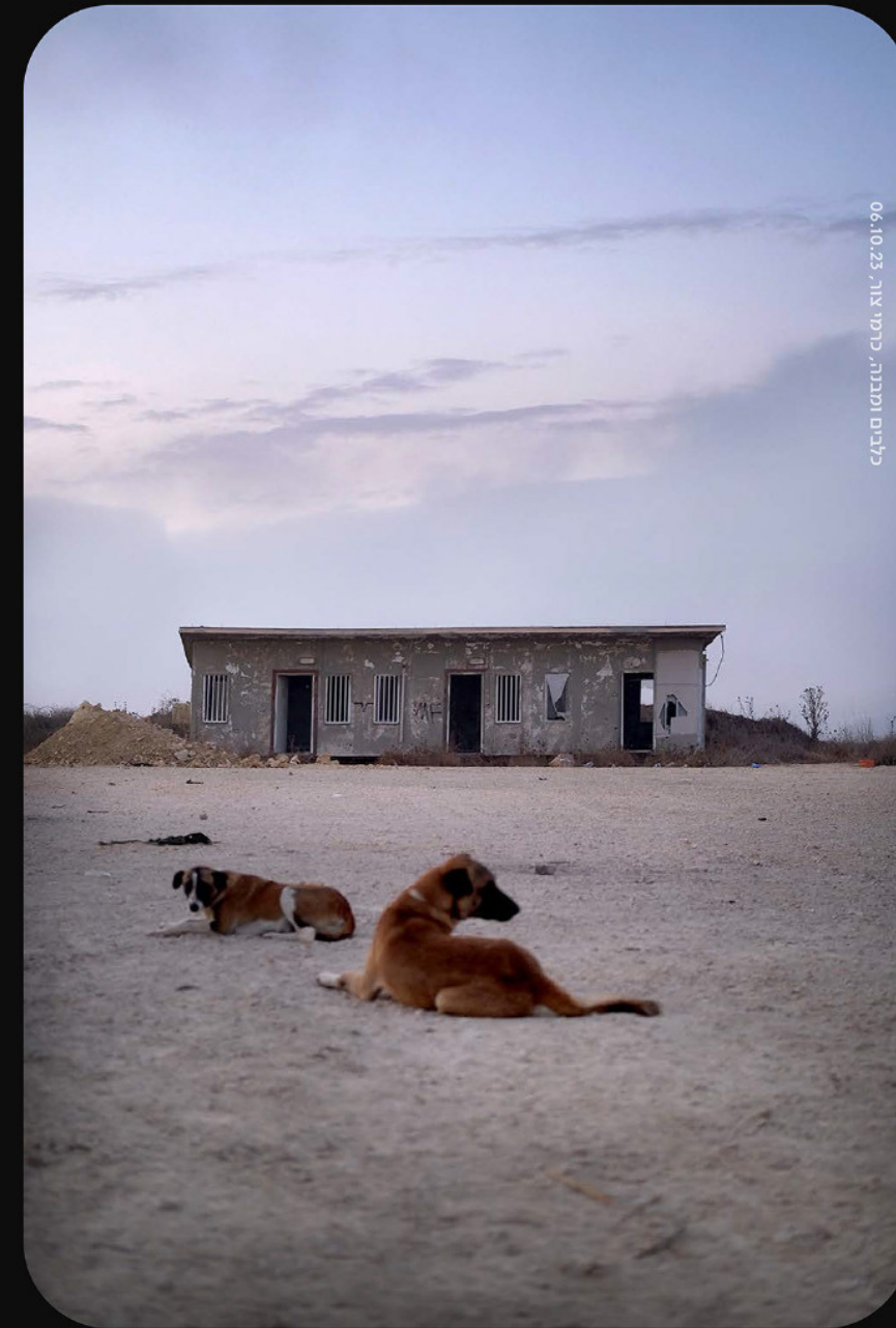
לביא ומנבגי, כרמי צור, 06.10.23

תערוכה בה מוצגים צילומי עיתונות מהארץ והעולם, תתקיים תערוכה של צילומי הייחודיים של לביא, מתוך הדף האישי שפירסם לביא באינס'. התמונות והדף מהוות יומן מצולם של עשייה והתפתחות אישית וצוותית, יומן של חברות מתגבשת וערכים, יחד עם התייחסות למצבים, אירועים, מקומות, ולכל מה שמתקיים מסביב. תערוכת עדות מקומית היא תערוכה המתקיימת מדי שנה במוזיאון א"י. זו תערוכה נחשבת שמגיעים אליה מדי שנה המוני מבקרים/ות.